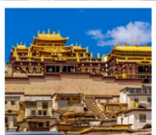
วัดลามะซงจ้านหลิง