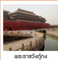
พระราชวังกรุง