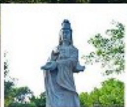
เจ้าแม่ทับทิม