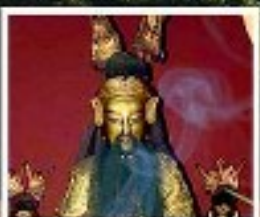
เอียงบู๊ซิว