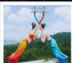
WULONG FLYING KISS