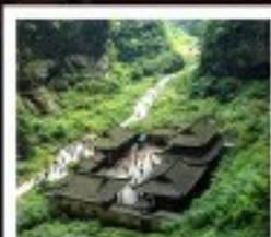
หลุมฟ้า สะพานสวรรค์

พระพุทธรูปทะเลสาบ / หมู่บ้านโบราณเมืองฮูเป่ย์ อุทยานหลุมฟ้าสะพานสวรรค์ / ระเบียงกระจก / อุทยานเมฆนางฟ้า ภูเขาโม่โกะ / Wulong Flying Kiss / เข็มปักถนนคนเดินเซี่ยฟางเป่ย์ เข็มปักหงหยาดิ่ง / มหาศาลประชาชน / เข็มปักไฟฟ้าสุดึก ถนนโบราณจีนฮั่ว / ศูนย์หมีแพนด้า