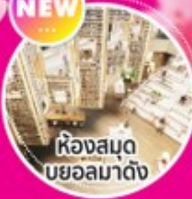
ห้องสมุด บยอลมาดัง