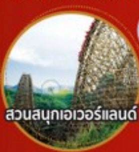
สวนสนุกเอเวอร์แลนด์