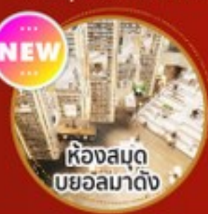
ห้องสมุด บยอลมาดิง