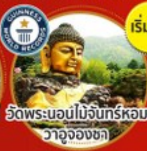
วัดพระนอนไม้จันทร์หอม วาจุงงซา