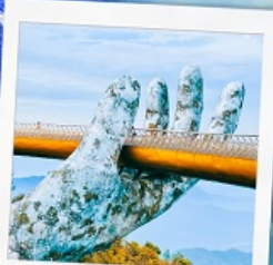
บาน่าฮิลล์