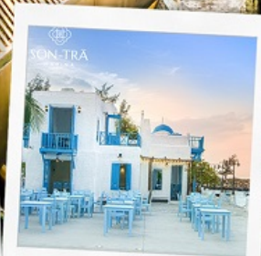
ซานตารีน่าคาเฟ่