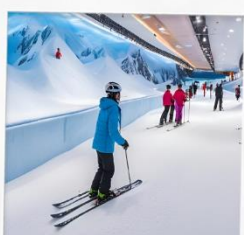
บ้านหิมะ WINDOW OF THE WORLD