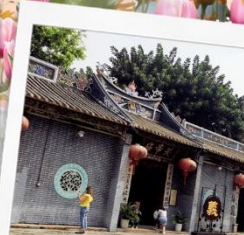
วัดกวนอูเซินเจิ้น