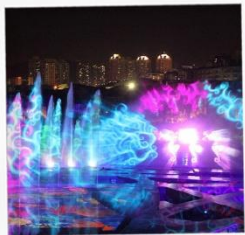
โชว์ม่านน้ำสามมิติ OCT BAY WATER SHOW