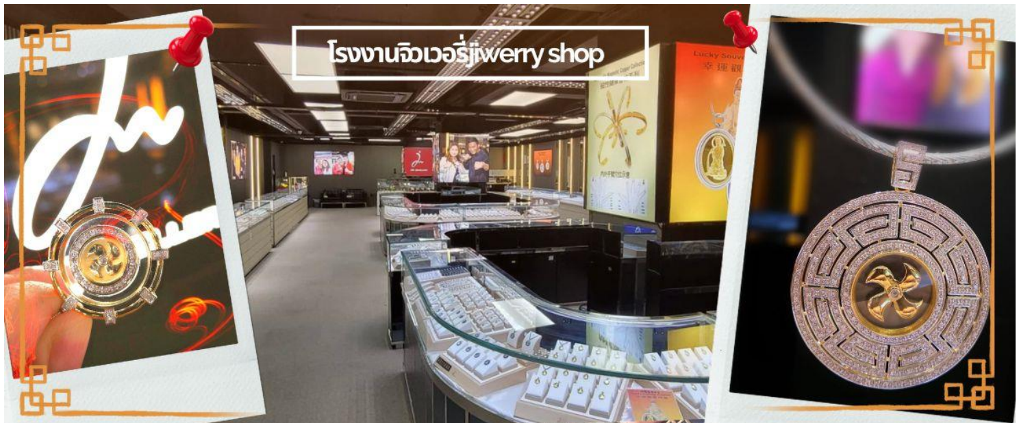
โรงงานจิวเวอรี่jewery shop

“วันเปิดทรัพย์” หรือ วันยืมเงินเทพเจ้า เป็นวันที่จะมาขอพรและยืมเงินเจ้าแม่กวนอิม ซึ่งตรงกับวันที่ 26 นับจากวันตรุษจีน ซึ่งพิธีนี้ใน 1 ปี มีเพียงครั้งเดียวเท่านั้น จากนั้นนำท่านชม โรงงานจิวเวอรี่ ซึ่งเป็นโรงงานที่มีชื่อเสียงที่สุดของฮ่องกงในเรื่องการออกแบบเครื่องประดับ อาทิเช่น จี้ และแหวนกำหั้น ที่สวยงามโดดเด่นไม่เหมือนใคร ซึ่งถือกำเนิดขึ้นที่นี่และมีชื่อเสียงที่สุดใช้เป็นเครื่องประดับติดตัว และเสริมดวงชะตา สินค้าทุกชิ้นมีเอกสารรับประกันคุณภาพเปลี่ยน ซ่อม ใต้ตลอดอายุการใช้งาน หากเกิดการชำรุดจากสินค้าไม่ใช่อุบัติเหตุ และนำท่านเลือกซื้อ เครื่องประดับที่ ร้านหยก ซึ่งคนจีนนั้นถือว่าหยกเป็นหิน ที่เป็นตัวแทนของความสวยงามและความบริสุทธิ์ มีความเชื่อว่าหยกมงคล ถ้าพกติดตัวไว้จะอายุยืนและสุขภาพดี