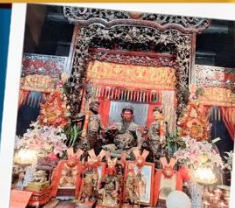
เทพเจ้ากวนอู วัดกวนไท่