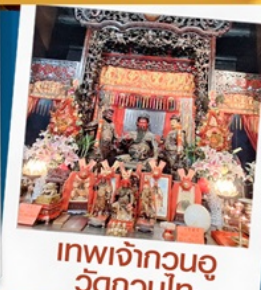
เทพเจ้ากวนอู วัดกวนไท่