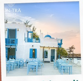
ซานตารีน้ำกาแฟ