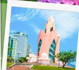
อาคารดอกบัว