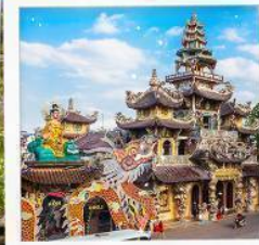
วัดมังกร