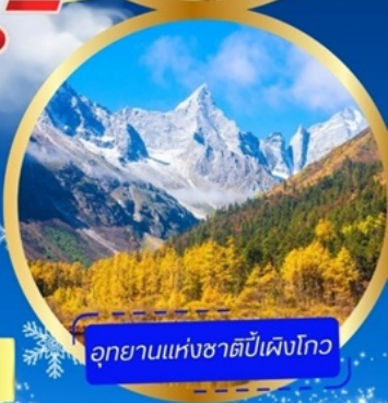
อุทยานแห่งชาติเป่ิงโกว