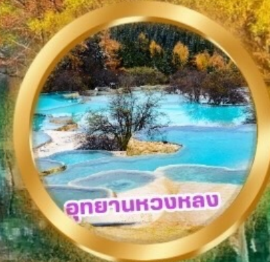
อุทยานหวงหลง