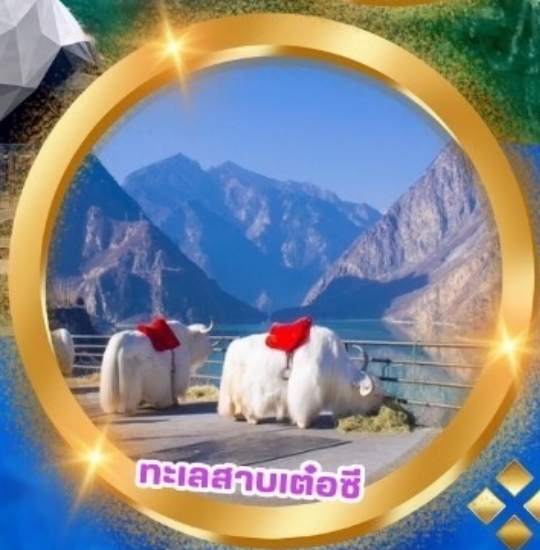
ทะเลสาบเต๋อซี