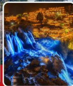
ฟูหลงเจิ้น