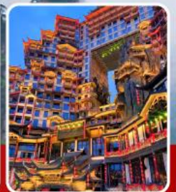
ตึก 72 ชั้น