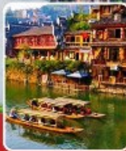
เมืองโบราณฟ่งหวง

เที่ยวฟิน 2 เมืองโบราณ พิชิตเขาวงกต แพนดอร่าของเมืองจีน