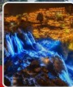
ฟูหลงเจิน