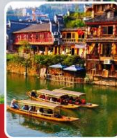
เมืองโบราณฟ่งหวง

อุทยานจางเจียเจี๋ย เขาเทียนจื่อซาน สะพานหนึ่งในใต้หล้า ทะเลสาบเป่าเฟิงหู ตึกมหัศจรรย์ 72 ชั้น เมืองโบราณฟูหลงเจิ้น เมืองโบราณฟ่งหวง ล่องเรือแม่น้ำถิวเจียง สะพานสายรุ้ง ซ้อปี้ง ถนนคนเดินหลงซิงอู่