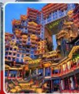
ตึก 72 ชั้น

อุทยานจางเจียเจีย เขาคิเยนจื่อซาน สะพานหนึ่งโบริตี้หล่า ทะเลสาบเป่าเฟิงหู ตึกมหัศจรรย์ 72 ชั้น เมืองโบราณฟูหลงเจิน เมืองโบราณฟ่งหวง ล่องเรือแม่น้ำถั่วเจียง สะพานสายรุ้ง ช้อปปิ้ง ถนนคนเดินหลงซิงลู่