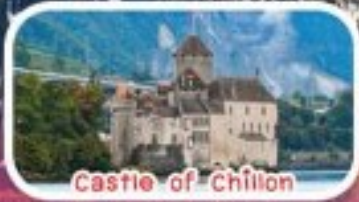
Castle of Chillon