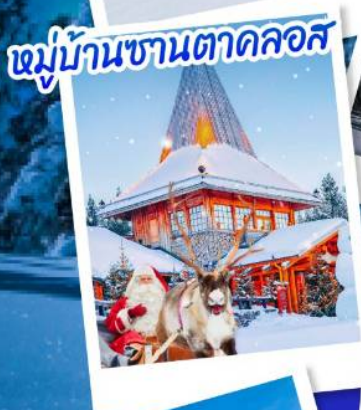
หมู่บ้านซานตาคลอส