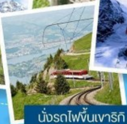
นั่งรถไฟขึ้นเทาริก