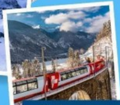
รถไฟเส้นทางกลาเซีย