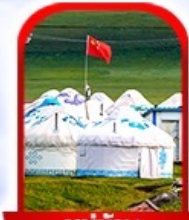
หมู่บ้าน พื้นเมือง