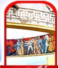
อนุสาวรีย์ โซซาน