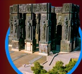
อนุสาวรีย์ประวัติศาสตร์