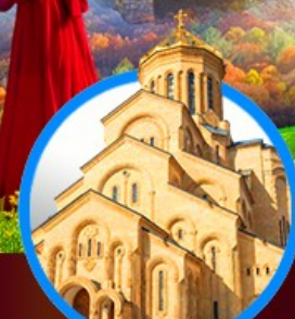
โบสถ์กรินดี เมืองทบิลีซี