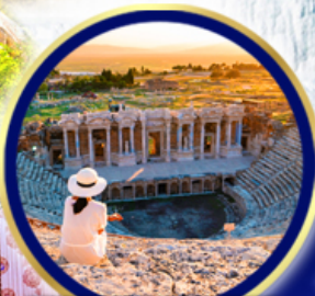
นครเฮียราโพลิส