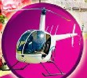
เปิดประสบการณ์พิเศษ นั่งเฮลิคอปเตอร์สูงตีฟ้า