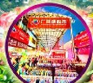
ฮ้อป ฮิม ฮิลล์ ไนท์บาร์เท็ด เรือฝ้างสู๋-ฮี้ตัง

ชอพรเจ้าแก้วอนันต์ ลูกยานพานานาณ = บ่อแกฮือฮันปี = หาดสวรรค์เทียนหยงไฟเรือ ถนนคนเดินริยฝ้างสู๋ = ทุ่งดอกกุหลาบฉ้างย้าหลง = ชมวิวลูกยานทวงงทเสียวทลิ่ง ห้างสินป-โร = ตพรมตัง = ตลาดกลางคืนฮี้ตัง