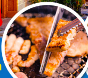
หมูย่างเกาหลี