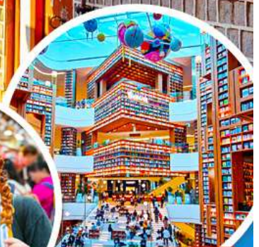
ห้องสมุด Starfield