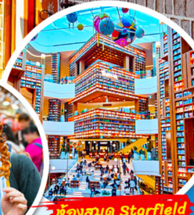
ห้องสมุด Starfield