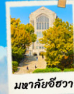
มหาชัยชีวา