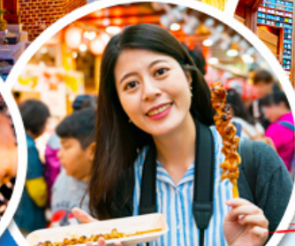
ตลาดควางจ้ง