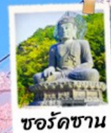
ชอริคซาน