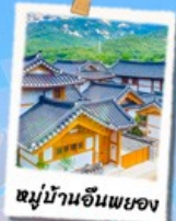
หมู่บ้านอินเพยง