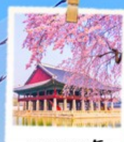
พระราชวัง