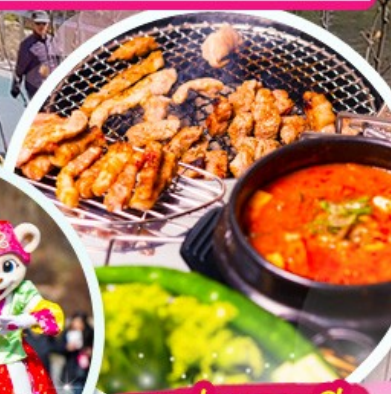
เมนูย่างเกาหลี