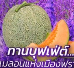
ทานบุฟเฟ่ต์... เมลอนแห่งเมืองฟูราโนะ