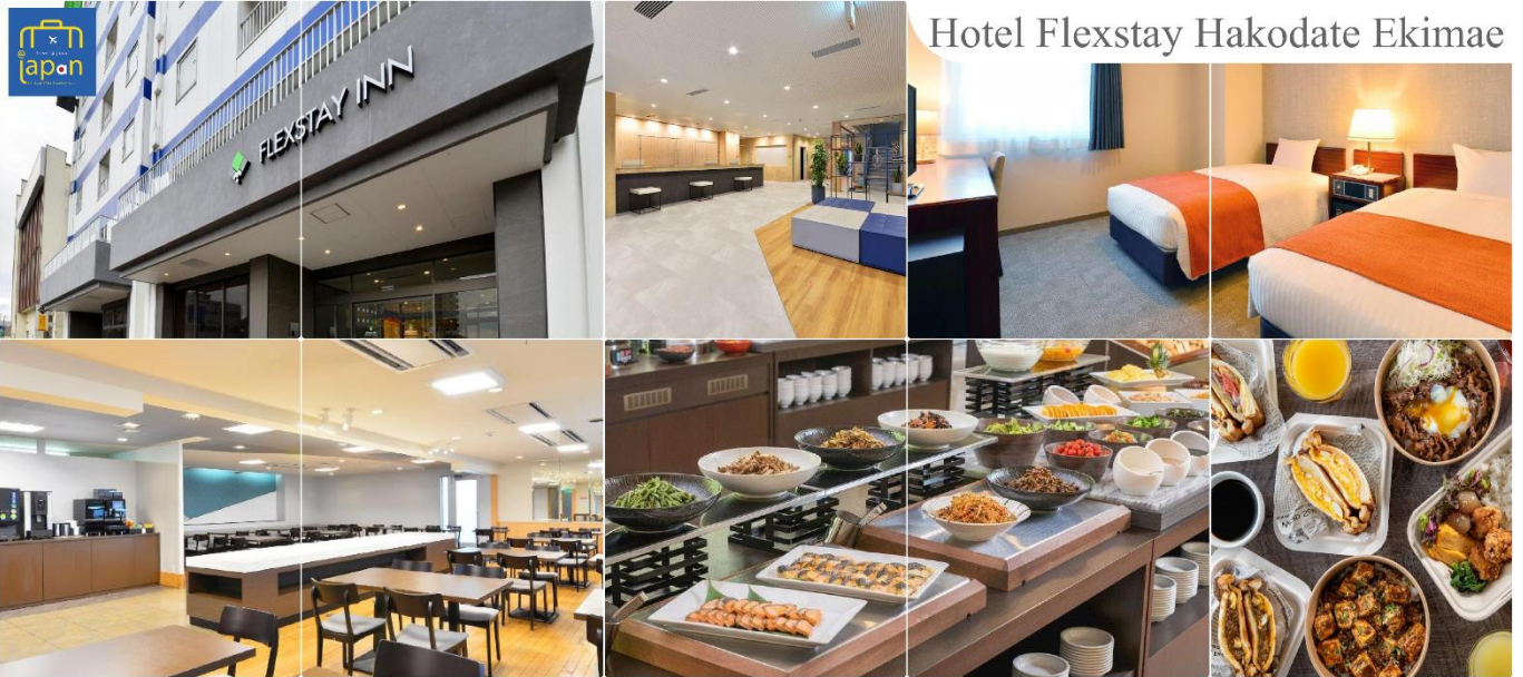
Hotel Flexstay Hakodate Ekimae