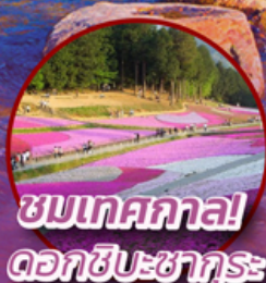
ชมเทศกาล ดอกชิบะซากุระ

📍 ไฮไลท์!! หุบเขาไฟฟูจิ คามิโคจิ ที่อยู่สูงชันทางเหนือเทือกเขาแอลป์ สัมผัสความงามของดอกชิบะซากุระ (Shibazakura Festival 2024) ย้อนยุคหมู่บ้านเอโดะ-จิ๋ว ณ เมืองเก่าคาวาโกเอะ หมู่บ้านโอชิโนะฮัคโค **อิสระฟรีเดย์ ซอปปิง สนุก หรือ ท่องเที่ยวกรุงโตเกียว 1 วัน เต็ม**