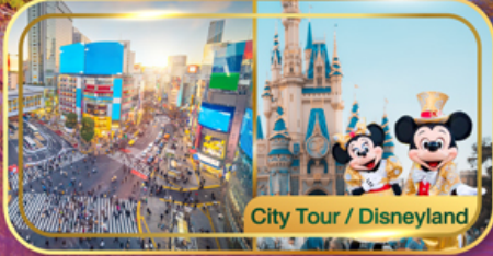
City Tour / Disneyland