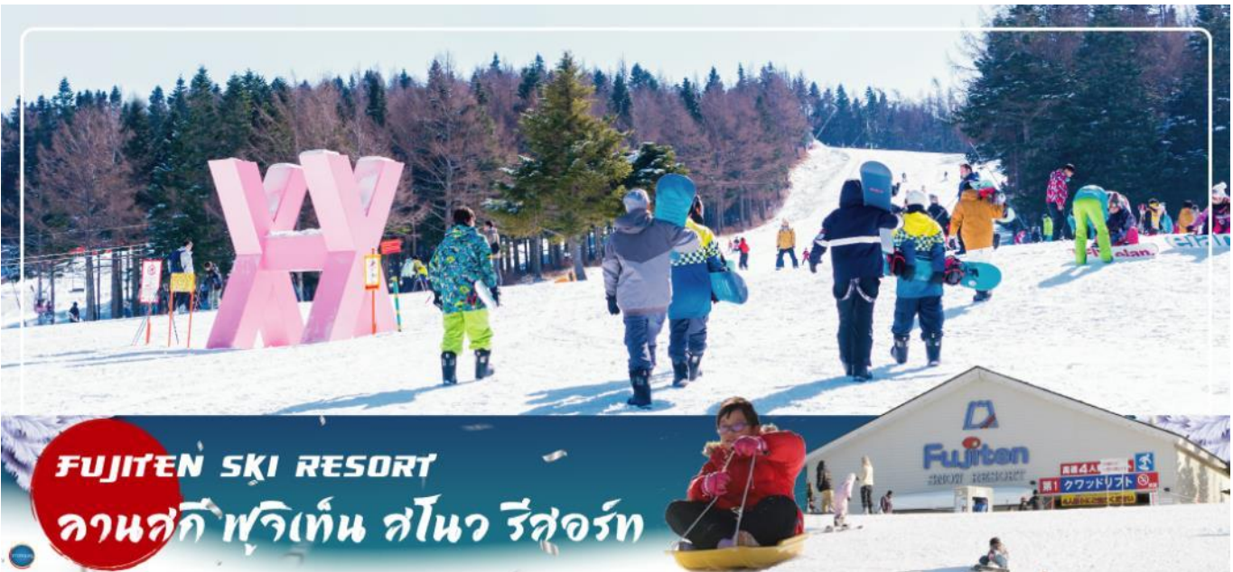
FUJITEN SKI RESORT ลานสกี ฟุจิเท็น สโนว รีสอร์ท

สัมผัสหิมะ ณ ลานสกี ฟุจิเท็น สโนว รีสอร์ท หรือ จุดชมวิวชั้น 5 ภูเขาไฟฟูจิ (ขึ้นอยู่กับสภาพ อากาศ) – พิธีชงชาญี่ปุ่น – กรุงโตเกียว – ชมแมวยักษ์ 3 มิติ พร้อมช้อปปิ้ง ย่านชินจูกุ – เมืองนาริตะ