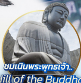
ชมเนินพระพุทธรเจ้า.. Hill of the Buddha

📍 ไฮไลท์!! สนุกสนานกับกิจกรรมทะเลหิมะ ณ ลานสโนว์ เวิลด์ ชิโฮฟานาโระมา เยี่ยมชมเนินพระพุทธรเจ้า ชมความน่ารักเหล่าสัตว์ ณ สวนสัตว์อาซาฮิยาม่า ชมคลองโอดารุ เข้าชมพิพิธภัณฑ์ถ้ำถ้ำสองดนตรี สัมผัสธารน้ำ ณ หมู่บ้านราเมนอาซาฮิคาว่า ช้อปปิ้งจุใจ กาญจนาโคริ อิมมอร์รอย!! บุปเฟ่ต์ซาบู และซาบูยักนิ