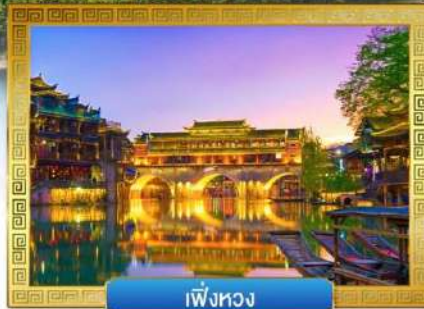
เฟิ่งหวง