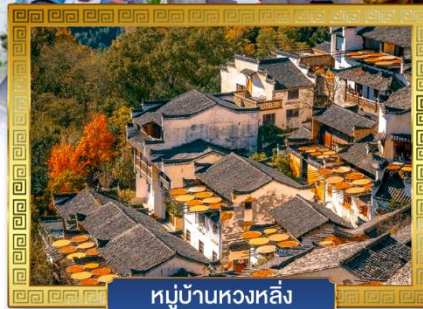
หมู่บ้านหวงหลิ่ง