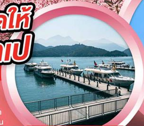
ล่องเรือทะเลสาบสุรียันจินทรา