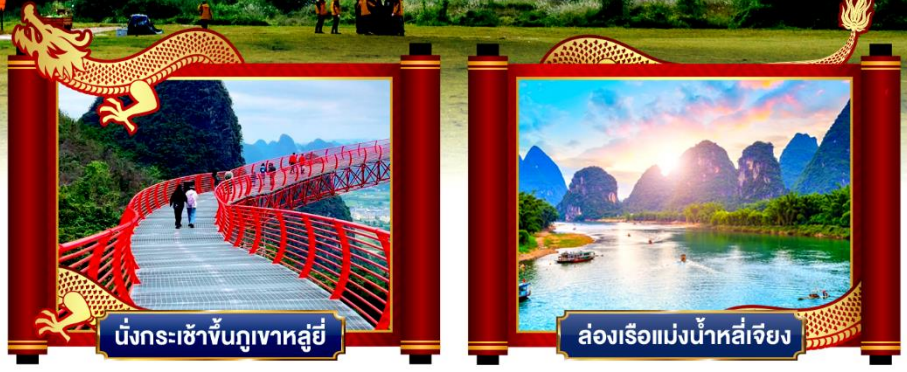
นั่งกระเช้าขึ้นภูเขาหลู่ยี่