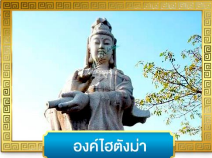
องค์ไฮตังม่า