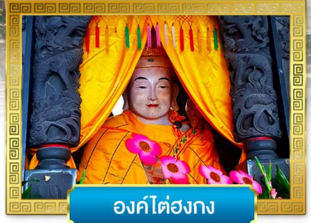
องค์ไต๋องกง