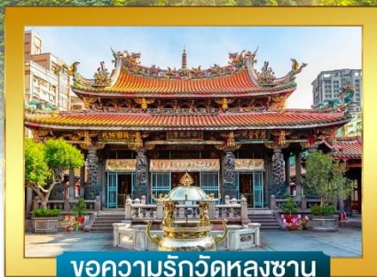
ใจความรักวัดหลงซาน