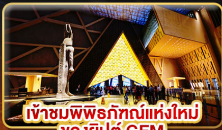
เข้าชมพิพิธภัณฑ์แห่งใหม่ ของียิปต์ GEM

ชม 1 ใน 7 สิ่งมหัศจรรย์ของโลก “มหาพีระมิดแห่งกิซ่า”