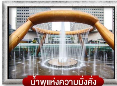
น้ำพุแห่งความมั่งคั่ง