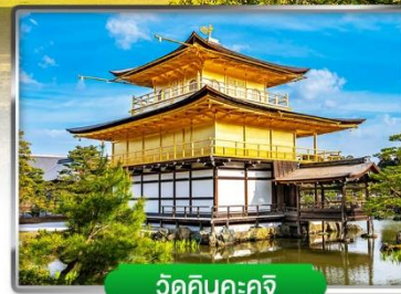
วัดคินคะคุจิ