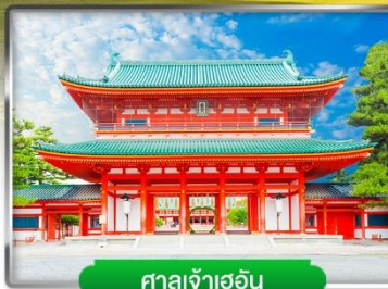
ศาลเจ้าเฮอัน