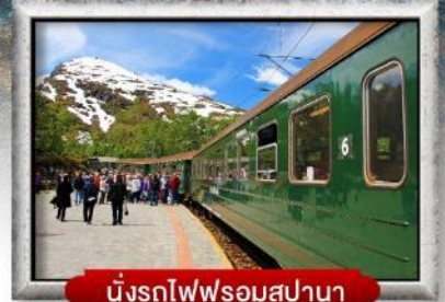
นั่งรถไฟพร้อมสเปานา

พิเศษ! พักบนเรือสำราญ แบบ Window Room 2 คืน, พักบ้านแซนต้าคลอส