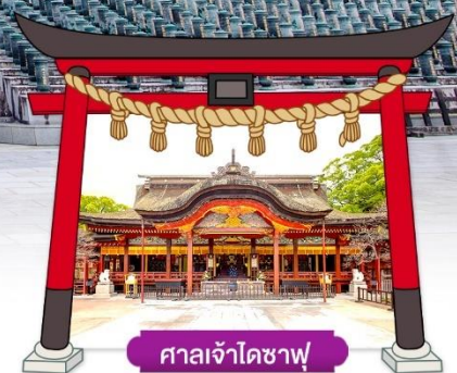
ศาลเจ้าโศซุ