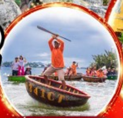
นั่งเรือกระดังงา Hoi an