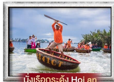
นั่งเรือกระดัง Hoi an