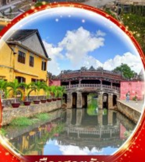
เมืองฮอยอัน