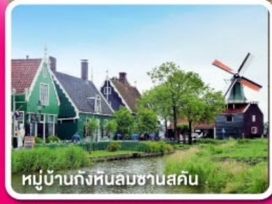
หมู่บ้านกังหันลมซานสคิน