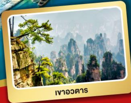
เขาอวตาร