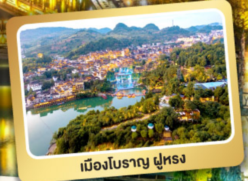
เมืองโบราณ ฝูหรง