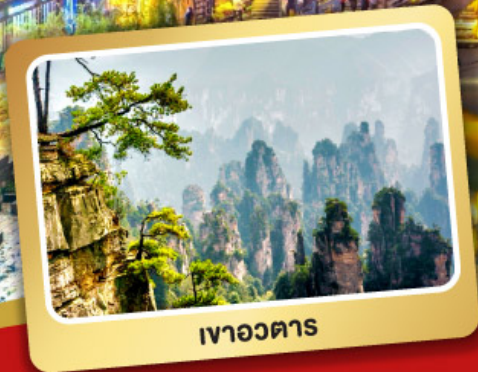
เวาอวตาร