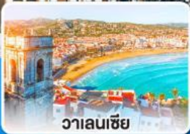
วาเลนเซีย