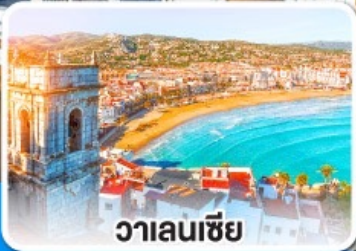
วาเลนเซีย