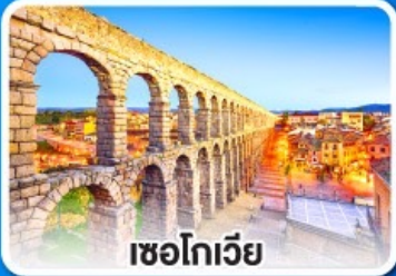
เซโกเวีย