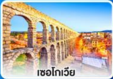
เซโกเวีย