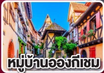
หมู่บ้านองกีเซม