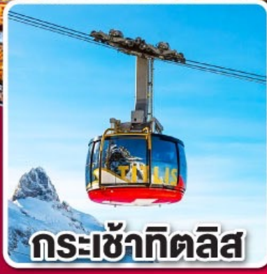
กระเช้าทิตลิส

"ทิตเซ" เมืองแห่งนาฬิกาทุกคู่ และ ต้นกำเนิดเค้กแบล็กฟอเรสต์