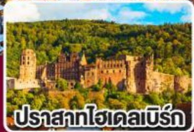
ปราสาทไฮเดลเบิร์ก