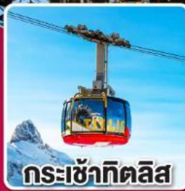
กระเช้าทิตลิส

"ทิตเซ" เมืองแห่งนาฬิกาทุกคู่ และ ต้นกำเนิดเค้กเบสิกฟออสต์