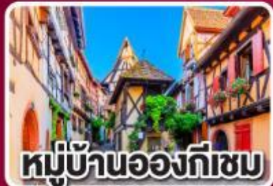
หมู่บ้านองก์เซม