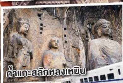
ถ้ำแกะสลักหลงเหมิน