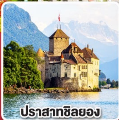
ปราสาทซิลยอง

ชมหมู่บ้านดอกบานาพันปี ณ เกาะไมนา ประเทศเยอรมนี