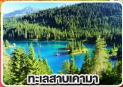
ทะเลสาบเคามา