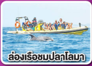
ล่องเรือชมปลาโลมา