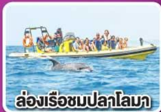
ล่องเรือชมปลาโลมา