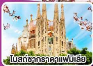
โบสถ์ซากราดาแฟมิเลีย