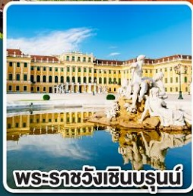
พระราชวังซินบรุนน์

บินตรงไปกลับ ด้วยสายการบินชั้นนำระดับ 4 ดาว คุฟท์ฮันซ่าและออสเตรียนแอร์ไลน์